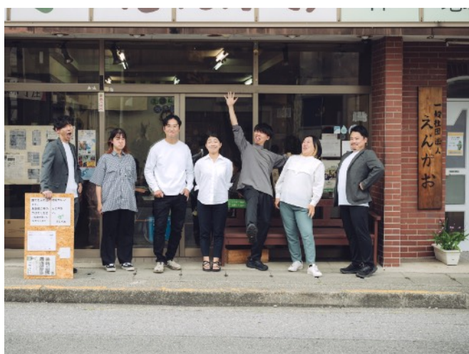
集合写真 一えんがおVer

私たちは、「ソーシャルビジネス」として、お金になりにくい社会課題にも向き合いながら、利益を出し、職員の給料をしっかりと払っていきける組織を目指しています。そのために、「収益事業」で利益を生むことに試行錯誤する側面と、「非収益事業」では寄付や会費・補助金などをいただいて、利益にならなくても社会のニーズに応える側面の両輪でありたいと考えています。